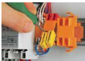
243-112 и 243-113