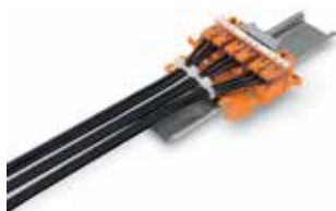
221-500 и 222-510