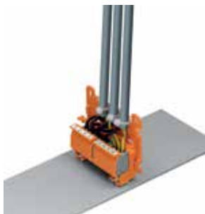
222-500 и 222-505