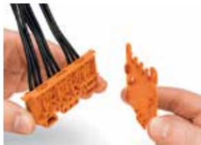
221-500 и 222-505